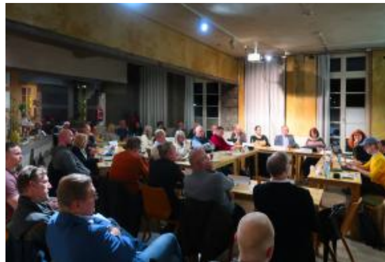
Die konstituierende Sitzung des Beirats fand im „Leerstand“ am Hauptbahnhof statt.

Auch die zweite Auflage der Brückenschlag-Konferenz hat gezeigt, dass das Format gut angenommen und auch im kommenden Jahr wieder als offene Plattform für Information, Dialog und Austausch fortgeführt wird.