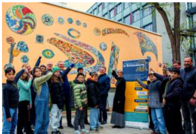
Das Mosaik wurde im November feierlich eingeweiht.